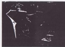
Capacitandos en una visita de campo

Para un tercer candidato, el país remitente se hará cargo de los costos totales.