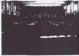
Auditorio del centro

Cabe mencionar que los objetivos del Centro no son sólo la capacitación en servicio de agrónomos de África, Asia, América Latina y Europa Oriental, en los diversos