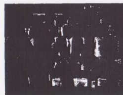
Embajadores asistiendo a la ceremonia de clausura