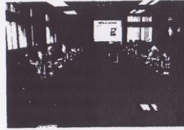
Participantes en la sala de conferencias

temas agrícolas sino además la concurrencia de los talentos de tales continentes, para el alcance del entendimiento personal y el reconocimiento de los problemas comunes, así como la evolución de nuevas técnicas para el desarrollo agrícola adaptadas a las condiciones de tales países mediante la amalgama de conocimientos.