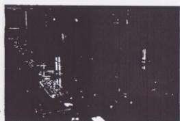
Sala de conferencias equipada con ordenadores

A principios de cada curso de capacitación el EICA ofrece un programa de orientación de una semana de duración, para